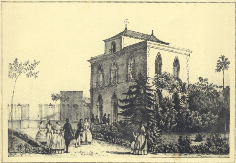
L' HOTEL THERMAL en 1848