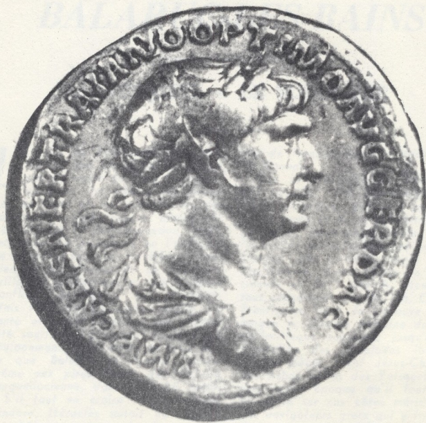
Médaille Romaine en or ( Trajan )

Une source de santé et son histoire : BALNEA TRAIANA